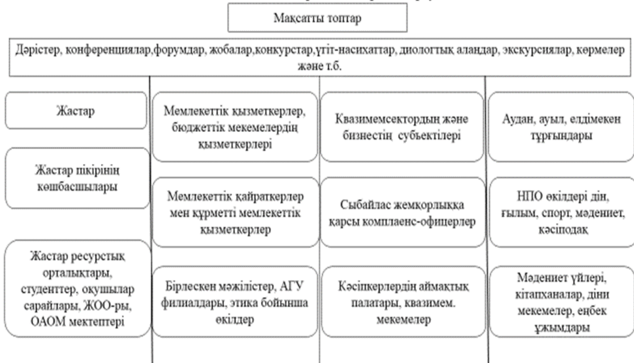
4-Сызба. Сыбайлас жемқорлыққа қарсы ағарту

Ә.Бөкейханов «Ұлт пен халыққа қызмет ету – білімнен емес, мінезден», ал «Халықтың пікірі мен еркі – заңның ең жоғарғы санкциясы» деген. Ә.Бөкейханов әрбір мемлекеттік қызметкер халықтың игілігі үшін жұмыс істеуге, жеке мүддесінен мемлекеттің мүддесін жоғары қоюға міндетті екендігін айтады.