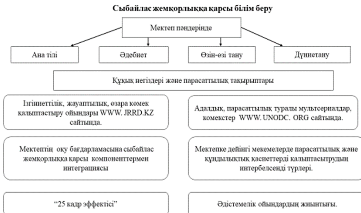
2 - Сызба. Сыбайлас жемқорлыққа қарсы білім беру